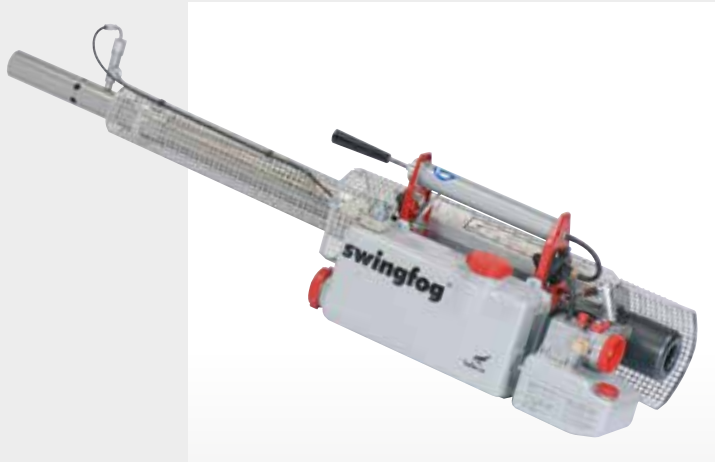
Swingfog SN 50