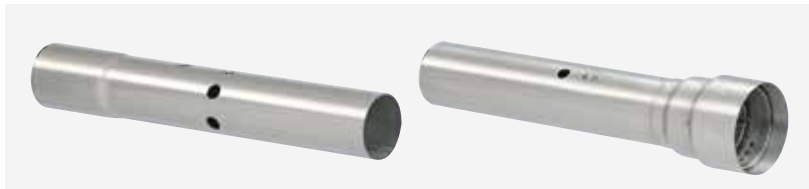
Standard-Nebelrohr für Wirkstoff- mischungen auf Öl-Basis