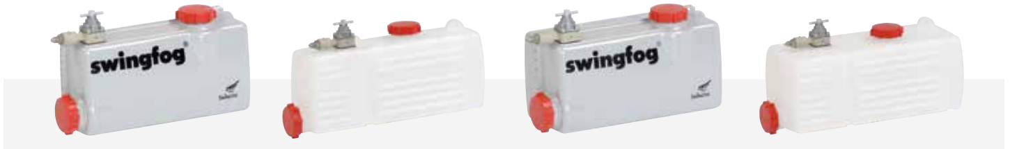
Wirkstofftank, Edelstahl Inhalt 6,5 l, Swingfog SN 50